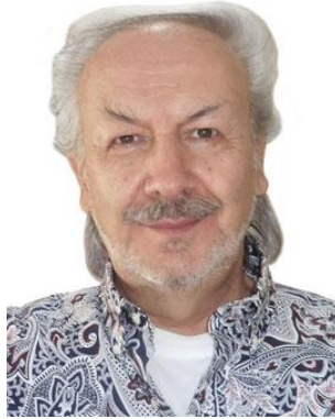
About Ahmed Hulusi

@AhmedHulusi: Dont just say I believe or dont believe in the One whose name is Allah. Realize what Allah means lest your world & eternal life becomes hell